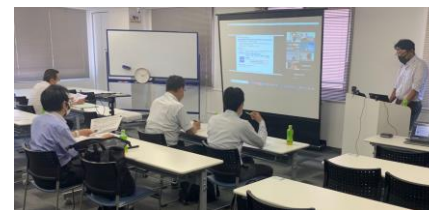
第1回事業運営委員会（令和4年7月21日開催）